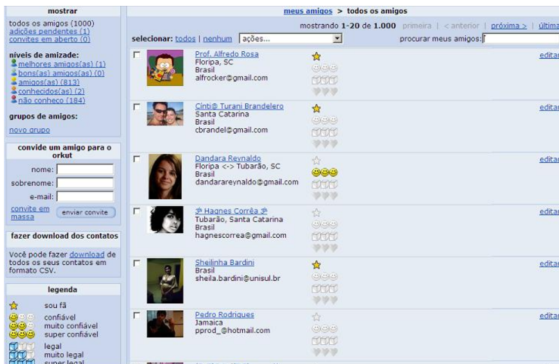
Figura 2 – Página de amigos no Orkut